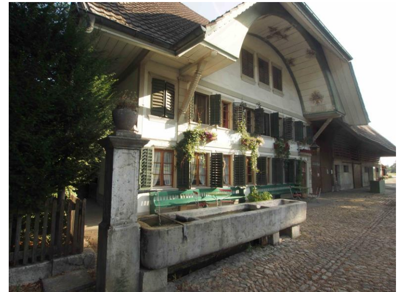
Ferienzeit auf dem Kulturhof

Hilfe für hirnerkrankte Kinder Mühlebachstrasse 43 8008 Zürich ☎ 044 252 54 54 info@hiki.ch www.hiki.ch